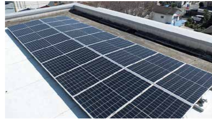
太陽光システムの設置イメージ ※屋上に最適な「置くだけ設置」の陸屋根専用架台

ただいま東京都内の建物に限り、太陽光発電システムの設置に伴い設置面の防水工事に対して助成金が適用される制度が東京都(クールネット東京)によってスタートしております!