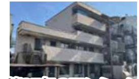
築27年のマンション