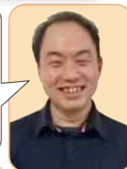
ハイウッド便り 制作担当:木暮

無料で建物の診断を承ります。 弊社では、無料で建物の診断をおこなっております。物件の情報をお伝えただけで、診断・報告書を作成いたします。“オーナー様のご意向に寄り添った提案”を心掛けておりますので、お気軽にお問い合わせください。