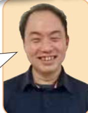
ハイウッド便り 制作担当:木暮

無料で建物の診断を承ります。 弊社では、無料で建物の診断をおこなっております。物件の情報をお伝えいただければ、診断・報告書を作成いたします。“オーナー様のご意向に寄り添った提案”を心掛けておりますので、お気軽にお問い合わせください。