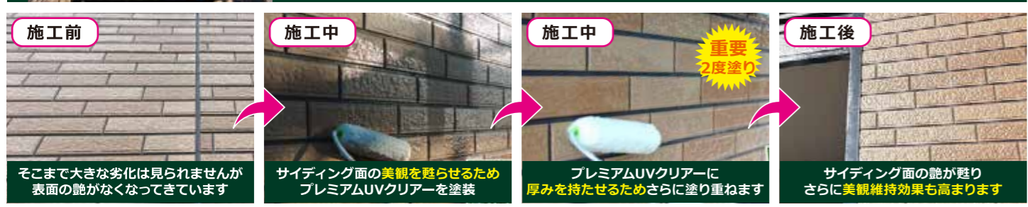
そこまで大きな劣化は見られませんが表面の艶がなくなっています サイディング面の美観を甦らせるためプレミアムUVクリアーを塗装 プレミアムUVクリアーに厚みを持たせるためさらに塗り重ねます サイディング面の艶が甦りさらに美観維持効果も高まります

築14年2階建てアパート 当物件は比較的築浅の物件になりますが、部分的に汚れてしまっている、または劣化症状が見られる部分は随所で散見されました。放置すると劣化症状が進んでいく一方ですので、 綺麗うちに改修工事 を提案させていただき、時代を超えて長く美観が維持できるように提案させていただきました。特にサイディング面は綺麗なタイル調で意匠性が高いデザインでしたので、 意匠性はそのままに、長持ちさせるクリアー塗料 を提案させていただきました。